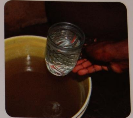
Smutsigt vatten blir rent...

– Det var billigt, det krävde ingen el och det hade goda rekommendationer. Det används av Rotary International och det finns på Haiti och i Pakistan. Så vi sände information om reningsverket till Manga Hill och frågade om det kunde vara intressant. De svarade "ja" och vi kunde sätta igång att jobba.