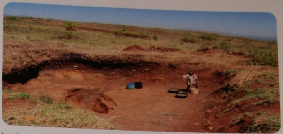
Uttorkad vattentäkt mars 2011

tro att man dricker rent vatten utan att göra det.