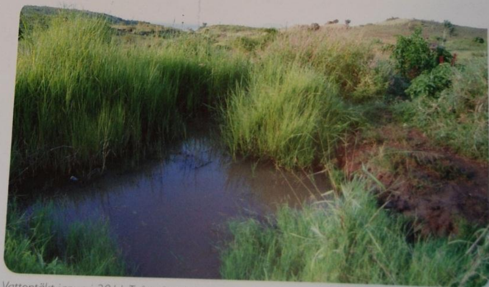
Vattentäkt januari 2011. Två månader senare var den helt uttorkad

– Man måste börja någonstans, säger My. Skulle alla starta projekt, eller svara på vad andra människor ber om, då skulle vi tillsammans kunna hjälpa hela världen! 🌍